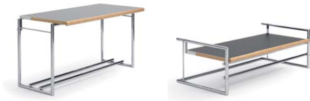
Schwarz und grau black and grey

Mesa regulable a dos alturas. Estructura de tubos de acero cromado. Tablero: superficie de linóleo, negra por un lado y gris por el otro con cola maciza de haya. Detalles ver lista de precios.